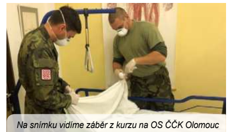
Na snímku vidíme záběr z kurzu na OS ČČK Olomouc

pro větší počet pacientů. Týmy plnily ošetrovatelské úkony po následující tři denní a tři noční směny. Pracovaly samostatně na principu rotace po 72 hodinách, odtud též název M-72. V průběhu 7 týdnů bylo v 11 nemocnicích, 13 covidových odděleních zapojeno 400 vyškolených dobrovolníků, kteří poskytli péči 1 800 pacientům.