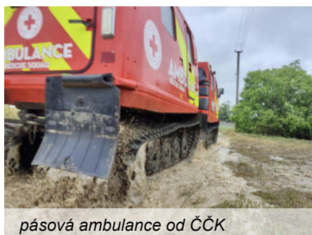
pásová ambulance od ČČK

rovněž ošetření a psychosociální pomoc. Pomoc Červeného kříže na místě podpořil ČČK částkou 5.000.000 Kč. Dodali jsme i prostředky na úpravu pitné vody. Do pomoci se zapojila i technika a vybavení od Českého ČK. Například pásová ambulance Hagglunds BV, která se dostane i tam, kde klasické auto nemá šanci. Jsme rádi,