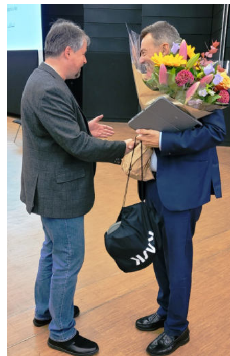
Loučení M. Jukla s prezidentem P. Maurerem

ly. Proto také byl počet příjemců pomoci a služeb Červeného kříže v roce 2020 o 800 milionů větší, než v letech předchozích (celkem za roky 2020 a 21 přijalo pomoc Červeného kříže spojenou s covidem-19 přes 1,2 mld. lidí). Uplatnilo se v praxi opět unikátní postavení Červeného kříže jako „pomocníka“ veřejné správy na zdravotním, humanitárním a sociálním