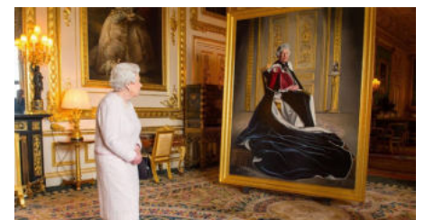
portrét Alžběty II. s bustou H. Dunanta