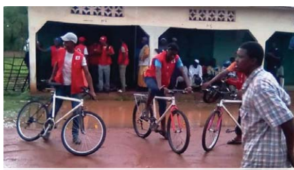
Jeden z týmů Gambijského ČK s koly ČČK