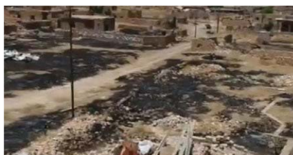
„Takto nyní vypadají místa, kde žili“