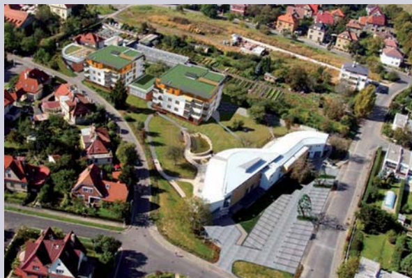
Dům seniorů ČČK „Hvězda“, Praha 6